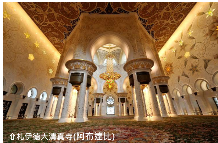
👉 札伊德大清真寺(阿布達比)