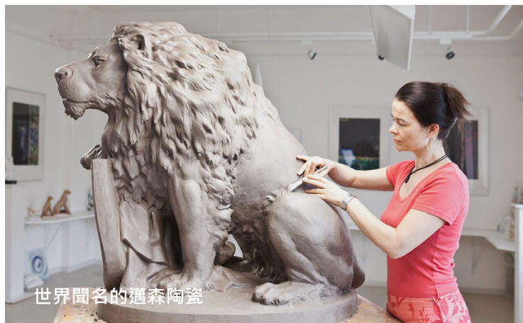
世界聞名的邁森陶瓷