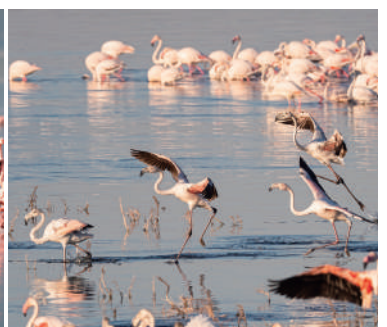
肯尼亞山國家公園或阿布岱爾國家公園